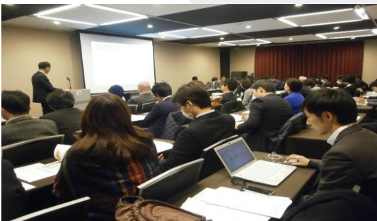
GENEQ NEW STAGE 2020 決起集会 (2016年2月)